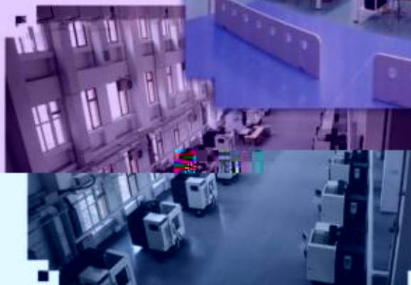
DMG 数控技术训练场所