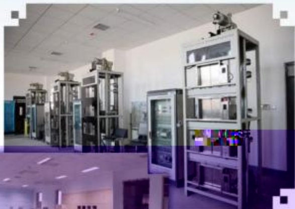
智能电梯安装调试维护训练场所